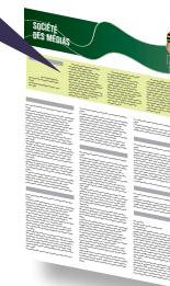
Mise en évidence